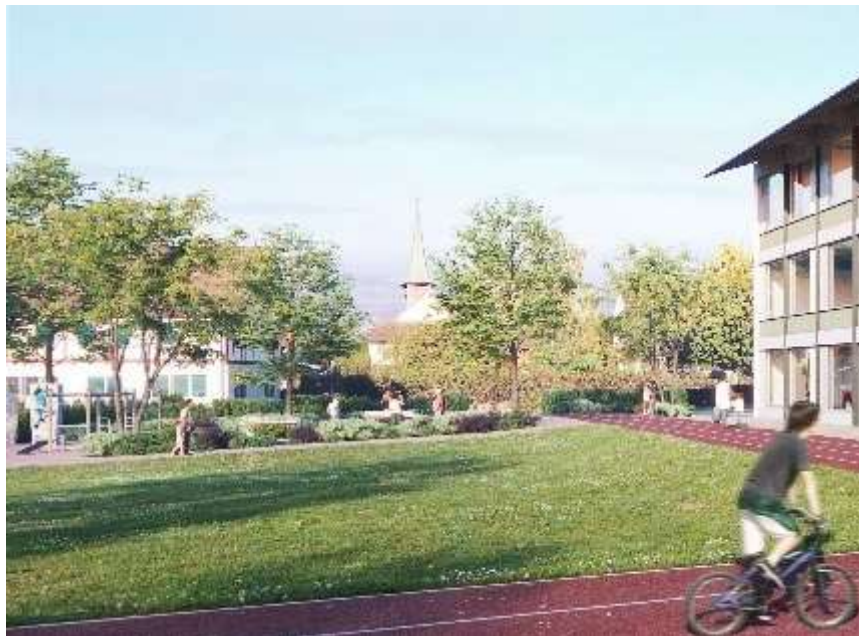
Abbildung 13: Visualisierung Schul- und Dorfpark (Sicht auf Gemeindehaus und Kirche)

Um der Forderung der Raumplanung des Kantons gerecht zu werden, ist ein kleiner Schul- und Dorfpark entlang der Stadlerstrasse vorgesehen. Als Pausen- und Begegnungszone wird diese Fläche für Jung und Alt zusätzlich aufgewertet.